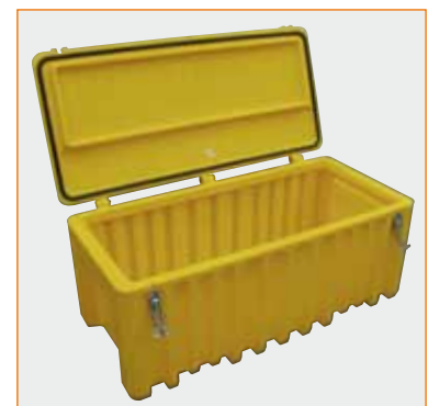
CEMbox 250l, gelb (weitere Sonderfarben lieferbar ab 25 Stück)