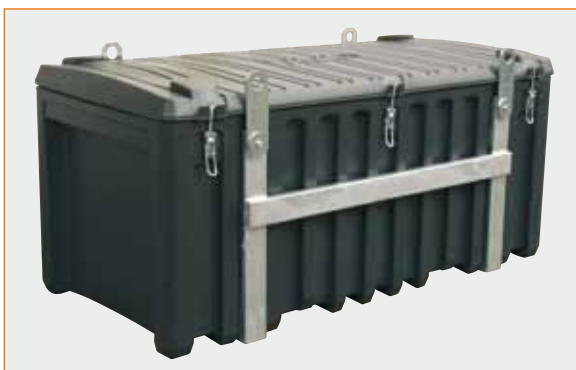
CEMbox 750 l kranbar