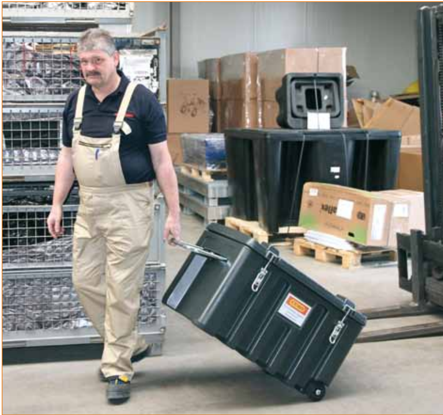
CEMbox Trolley 150l mit Räder Ø 100mm und Klappbügel