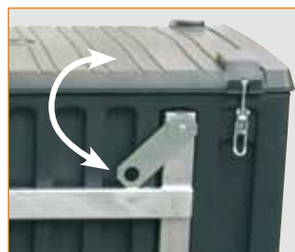
Krangestell mit schwenkbaren Kranösen (bei CEMbox 750 l kranbar)