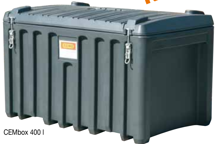
CEMbox 400 l